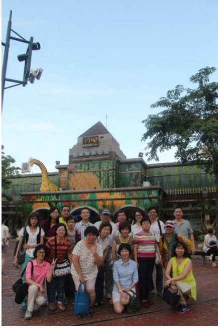
17:42 火車站前聲聲催， 小小羊兒該回家囉！