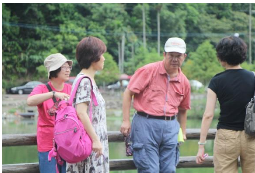
老師開講，學生靜聽。