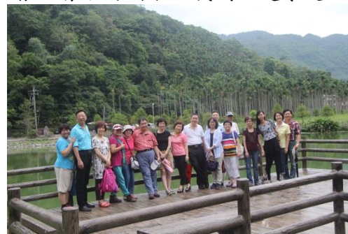
除了掌鏡美女未入境，目前全員到齊。

欣賞完望龍埤，該歇歇腿了，此時是大家最期待的時刻，因為要開拔到今晚的享樂休閒之地-礁溪長榮鳳凰酒店。