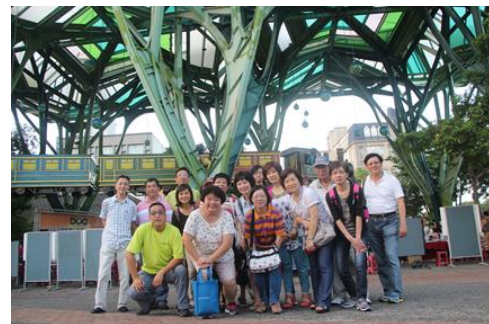
幾米作品-搭火車去也