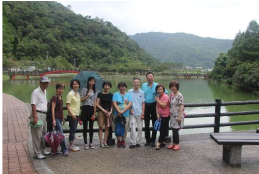
靜謐清澈的湖水，我們一起享受。