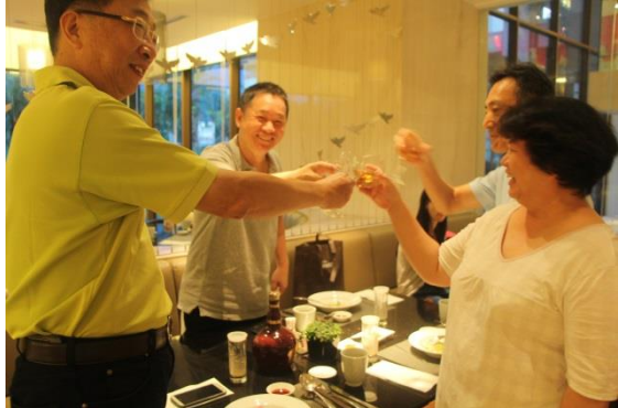
威士忌四人幫，胖燕琍遮了台生，孝天太高放不進鏡頭，Sorry！元夫是主角？