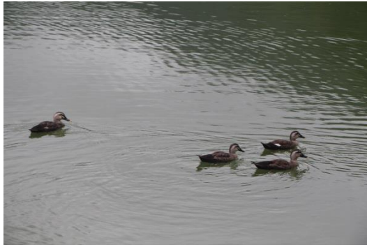
春江水暖鴨先知，卻道天涼好個秋！