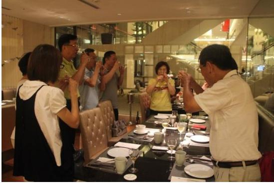
大家舉杯祝福！許久不見，看到大家身體健康，平安喜樂，真好！