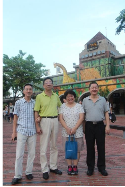
17:45 火車站前憶起 35 年前常在一起 讀書打屁的美好時光，期待下次相聚！