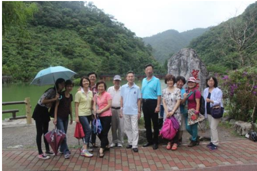
望龍埤，我們到此一遊。